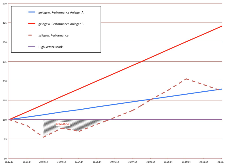
Abb.: Die Grafik veranschaulicht den Unterschied einer gleichmäßigen Performance im Gegensatz zu einer Performance, bei der die Hauptinvestition zum Zeitpunkt des niedrigsten Anteilspreises und die Entnahme zum Zeitpunkt des höchsten Anteilspreises des Betrachtungszeitraums erfolgte.

Die Vergütung der Leistungen des Fondsmanagers werden nicht durch eine im Fondspreis enthaltene Performance Fee über alle Investoren im Verhältnis der Anteile umgelegt, sondern können kundenindividuell vereinbart und errechnet werden.